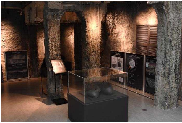
土崎空襲で被爆した旧日本石油秋田製油所の倉庫の柱や梁の一部を移設し展示