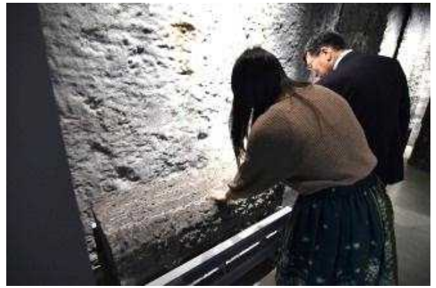
移設した柱の一部は、直接触れることができます