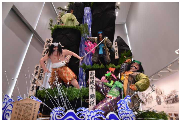
曳山(置山)は、越前谷人形店さんや、地域の皆様のご協力で完成しました