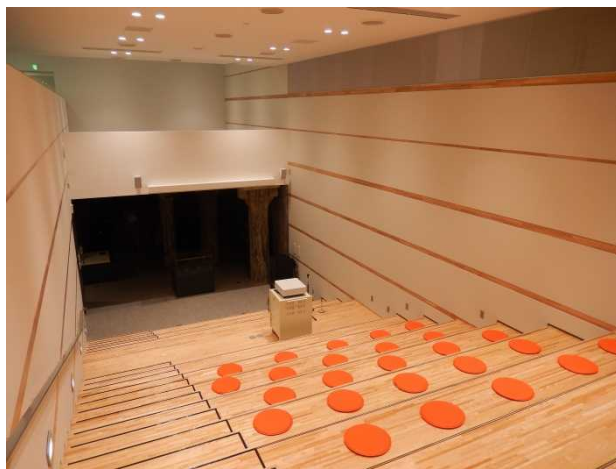
階段教室(奥が空襲展示コーナー)