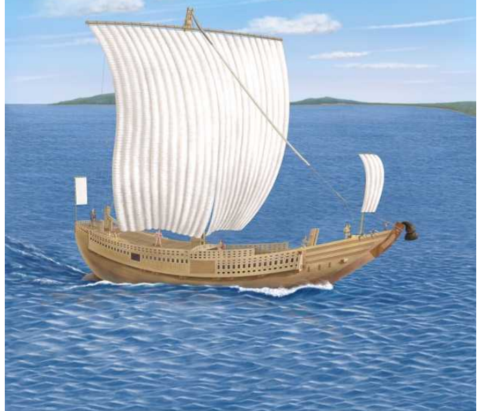
北前船のパネルイメージ図。今秋、実物の10分の1サイズの模型も設置する予定です