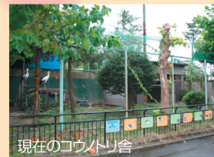
現在のコウノトリ舎

老朽化が進んでいるコウノトリ舎の改修工事を今年12月から行います。外側のフェンスと動物舎をリニューアルする予定です。来年3月に完成の予定です。