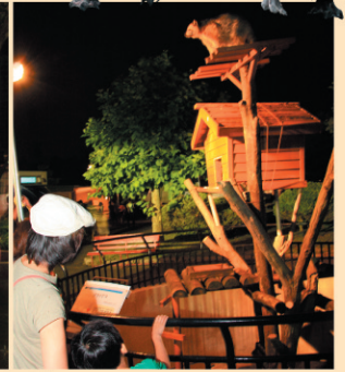
いつもと違う表情の動物たち。左はフラミンゴ。右はアライグマ。