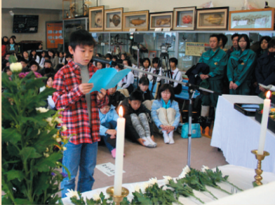
昨年度の慰霊祭の様子

今年の通常開園の最後の日となる、11月30日に皆様と動物達への感謝の気持ちを込めて、「さよなら感謝祭」を開催します。動物慰霊祭や特別なイベントなどを予定。今年最後の大森山動物園に是非お越しください。