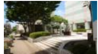
ポケットパークのイメージ