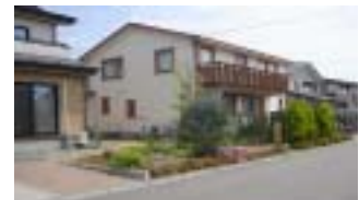
オープンガーデンのイメージ