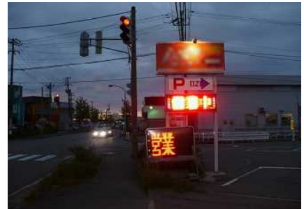
[一般的な照明付き広告物]