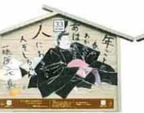
設置町名 元町23 設置場所 高多茂商店 制作者名 三木 由起子