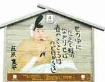
設置町名 表町5 設置場所 高長寿司 制作者名 阿部 萌