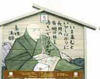
設置町名 表町5 設置場所 旧勝平酒造 制作者名 畠山 真梨子