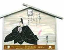
設置町名 日吉町10 設置場所 日吉神社 上境内 制作者名 野崎 宏平