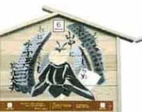
設置町名 表町9 設置場所 高島松月堂 制作者名 保坂 里美