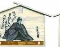
設置町名 表町4 設置場所 石忠老舗 制作者名 石田 敬太郎