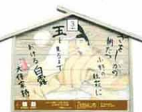
設置町名 表町2 設置場所 天龍寺 制作者名 三木 由起子