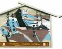
設置町名 元町5 設置場所 大塚商店 制作者名 岩館 由貴子