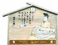
設置町名 表町2 設置場所 黄金井酒造 制作者名 笠井 雅広