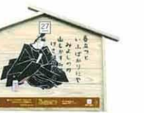
設置町名 元町4 設置場所 赤沼宅 制作者名 富永 すおみ