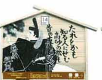
設置町名 比内町6 設置場所 日本製紙クラブ 制作者名 佐藤 未歩