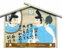
設置町名 日吉町10 設置場所 日吉神社 下境内 制作者名 小野 春美