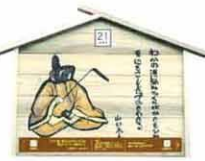
設置町名 栗田町27 設置場所 忠専寺 制作者名 石田 敬太郎