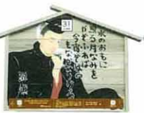
設置町名 元町22 設置場所 山本商店 制作者名 阿部 萌