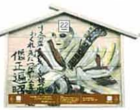
設置町名 栗田町26 設置場所 渡金商店 制作者名 斎藤 雅夫