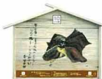
設置町名 表町14 設置場所 汗かき地蔵 制作者名 斎藤 雅夫