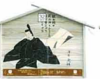
設置町名 元町23 設置場所 長寿の泉 制作者名 野崎 宏平