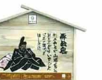
設置町名 日吉町3 設置場所 愛宕下流れ井戸 制作者名 高木 拓