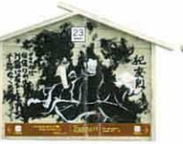
設置町名 元町14 設置場所 南波肉店 制作者名 高木 拓