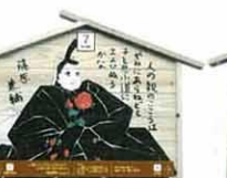
設置町名 表町9 設置場所 森九商店 制作者名 畠山 真梨子