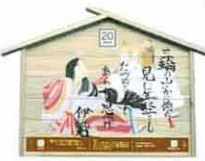
設置町名 表町4 設置場所 高橋宅 制作者名 保坂 里美