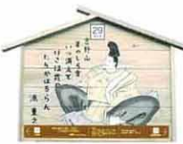
設置町名 元町15 設置場所 渡辺宅 制作者名 富永 すおみ