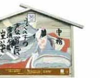
設置町名 表町4 設置場所 大彦商店 制作者名 岸本 耕平