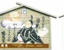
設置町名 元町22 設置場所 料亭友よし 制作者名 保坂 里美