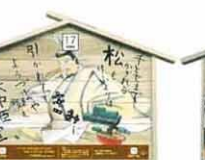
設置町名 日吉町35 設置場所 葉隠墓園 制作者名 三木 由起子