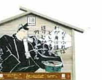
設置町名 日吉町2 設置場所 実相寺の湧水 制作者名 笹山 快