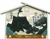
設置町名 日吉町9 設置場所 薬王院流れ井戸 制作者名 佐々木 夏子