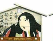
設置町名 日吉町7 設置場所 余楽庵 制作者名 小野 春美