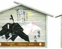
設置町名 栗田町1 設置場所 緑町の地藏堂 制作者名 野崎 宏平