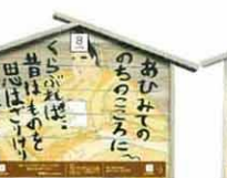
設置町名 表町10 設置場所 大門宅 制作者名 上田 修司