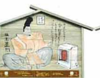
設置町名 日吉町8 設置場所 森川家 制作者名 笠井 雅広