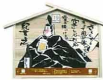
設置町名 日吉町2 設置場所 門前町流れ井戸 制作者名 笹山 快