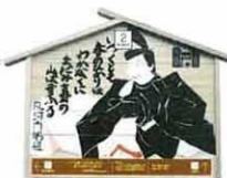
設置町名 表町2 設置場所 森川酒造店 制作者名 岸本 耕平