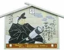
設置町名 元町22 設置場所 大嶋宅 制作者名 佐々木 夏子