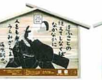
設置町名 栗田町1 設置場所 栗田神社 制作者名 岩館 由貴子