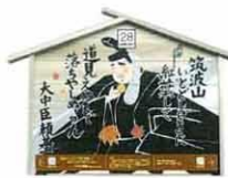
設置町名 元町14 設置場所 仙葉善治商店 制作者名 佐藤 未歩