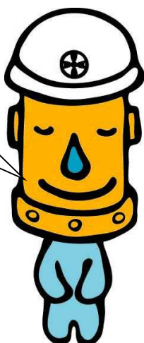
上下水道局マスコットキャラクター「カンちゃん」(水乃環太朗)

お問い合わせ先 秋田市上下水道局 ( 課 係 ) 担 当 TEL ( 昼 ) TEL ( 夜 ) ----- 施工業者 現場代理人 TEL