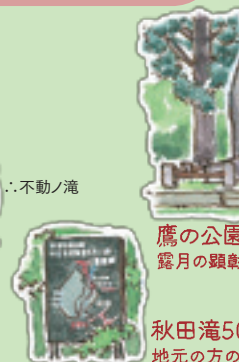
鷹の公園 露月の顕彰 秋田滝50 地元の方の