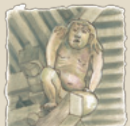
26 新波神社の力士 力士8体! あなたのハートを支えます チームR(力士)