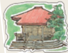
新波神社のみこしが入る建物 階段のカーブがきれい