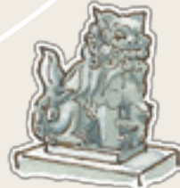
新波神社の狛犬 子どもの狛犬がいます