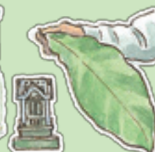
高尾山 ほこら 階段の途中にあります みつけられるかな?