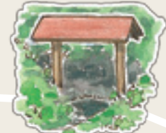
新波神社の湧き水 こんこんと湧き出しています