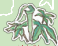
まむしぐさ 鎌首をもたげた姿に似ています