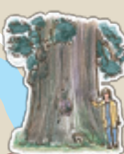
16 高尾神社里宮の大杉 市指定天然記念物 樹齢1,000年以上といわれています