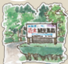
花木観光農園 緑豊かな市民の憩いの場