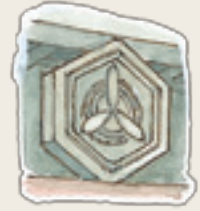
新波神社手水舎の社紋 がまの穂