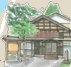
18 露月山廬書齋 市指定史跡 明治34年に設けられた書齋