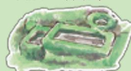
高尾山 湧き水 サンショウウオがみられるかも