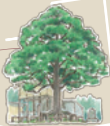
②⑦ 竹の花の一本杉 市指定天然記念物 ほこらがあります