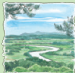
高尾山横長根 絶景!