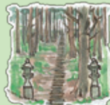
99段の階段 女人禁制 米子の伝説 心臓破りの99段の階段