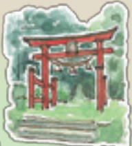
高尾山 登山口 市内から車で登れるのは2か所