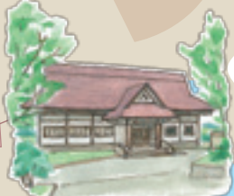
②⑧ 旧雄和ふるさとセンター 閉館しましたが、3日前まで連絡すれば観覧できます