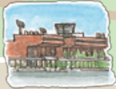
⑫秋田空港 秋田のお土産を売っています