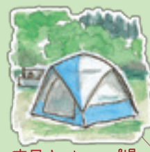
高尾山 キャンプ場 みんなで使おうキャンプ場