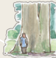
新波神社の夫婦杉 あなたは何を思いますか？