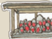
お地藏様や観音 村中から集まりました