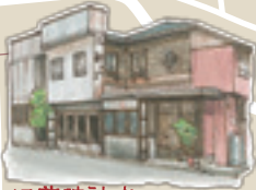
工藤時計店 以前は外に時計がついてました