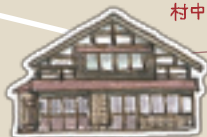
齊藤商店 元塩・たばこ屋さん