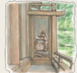
新波神社の彫刻 ミステリー★などの彫刻