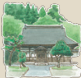
⑬松連寺 境内には樹齢300年以上の「門前の杉」があります