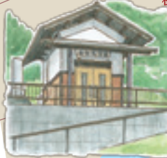
17 米女鬼文庫 蔵書は3,000冊ほど!