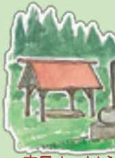
高尾山 すもう 9月の高尾山まつり すもう大会が開か