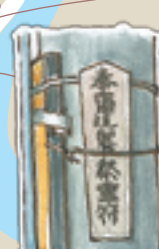
お札 外部からの災厄を防ぐお札です。 各地で見られるかも?