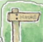
こもれびの道 散策路の名前がすてき