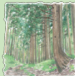
高尾山 杉 木々に癒やされます

高尾山は、雄和地区の中央西部にそびえています。標高380m。8合目までは車で登れます。