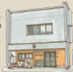
24 おけさ会館 元呉服屋さん