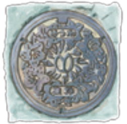
マンホール 旧雄和町の町花はツツジ。 町の木は柿です。