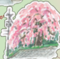
川崎のしだれ桜 明治中期に佐竹家から もらい上げたといわれています