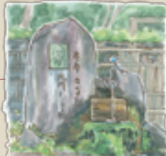
20 石巻の清水 露月が愛しました