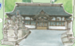
19 玉龍寺 ぼけ防止のお地藏様が たくさん