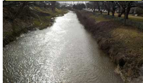
② 御茶屋橋 付近