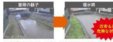
カメラ画像ではプライバシーに配慮し、家屋等にマスキングを施しています。