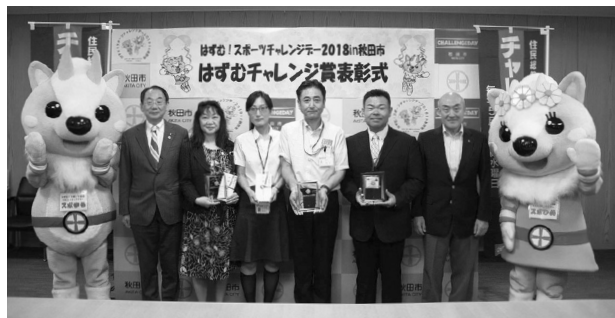
はずむチャレンジ賞表彰式(7月31日)

5月に開催した「はずむ！スポーツチャレンジデー」で、ユニークな取り組みを行った団体を表彰しました。受賞団体とその取り組み内容は下記のとおりです。みなさんご参加ありがとうございました。スポーツ振興課☎(888)5611