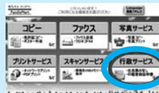
(例)ファミリーマートでの画面