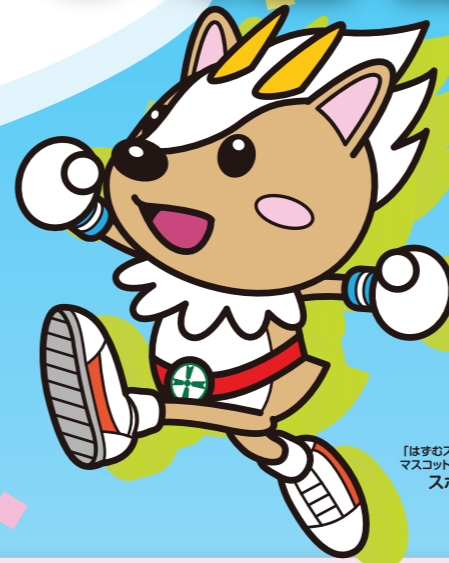
「はずむスポーツ都市」 マスコットキャラクター スボまる