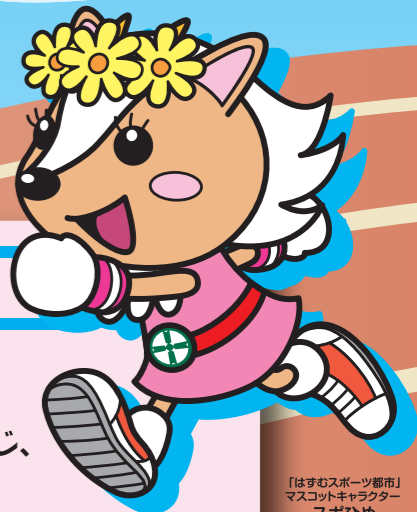
「はずむスポーツ都市」 マスコットキャラクター スボひめ