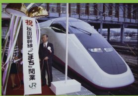
平成9年3月 秋田新幹線が開業