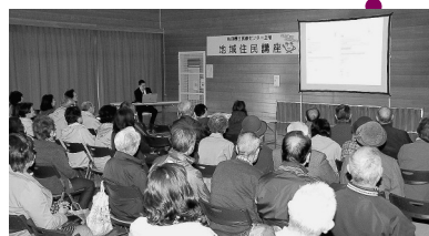
約70人が参加しました

4月13日、飯島南地区コミセンで、地域住民講座「元気に過ごすためのヒント」が開催されました。