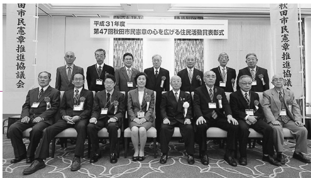
平成31年度 第47回秋田市民憲章の心を広げる住民活動賞表彰式