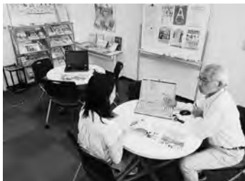
室内にはじっくり相談 できるスペースが