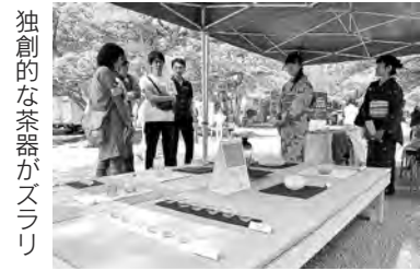
独創的な茶器がスラリ