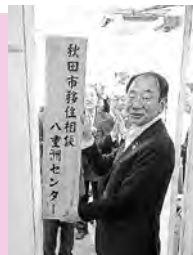
入口に看板を掲 げる穂積市長

住所▶東京都中央区京橋一丁目4-14 TOKIビル6階☎0120-99-1101 開館時間▶月~土曜、10:00~18:00