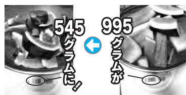
スイカの皮を自然乾燥で