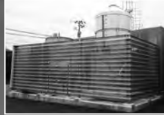
秋田公立美術大学 (ペレットボイラー)