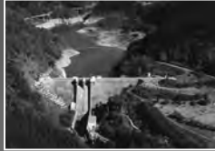
岩見ダム (水力発電)