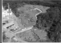
総合環境センター (メガソーラー)