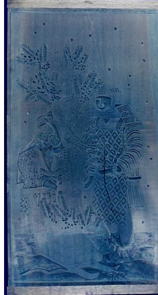
⑧花四題 「冬(なんてん)」