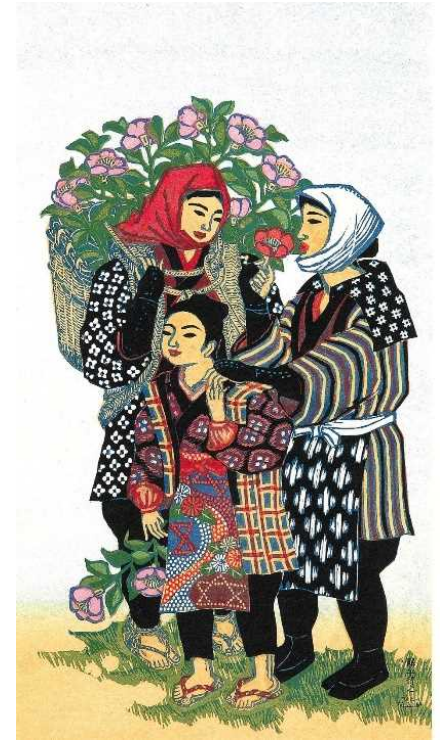
⑤花四題 「春(ツバキ)」 版木全面