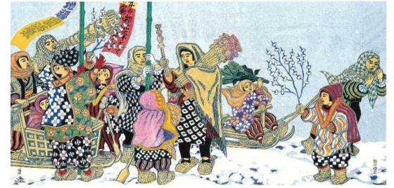
(右) ⑩「雪国の子どもたち」