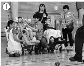
① NPO法人にこつと秋田「多機能型重症児者デイサービスにの」のかたも、補助具を使い参加しました (写真①②)