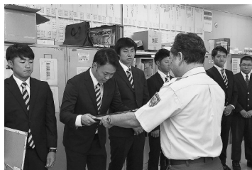
8月22日の感謝状贈呈式で

8月6日に下浜海水浴場で起きた水難事故の際、冷静で的確な活動により人命を救助した次のみなさんに、秋田消防署長から感謝状を贈呈しました。ご協力ありがとうございました。秋田消防署 ☎(823)4100