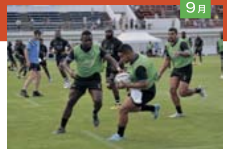
W杯の事前合宿で、フィジー共和国代表チームが秋田市を訪れました。迫力のプレーを間近で観戦！（9月7～12日）