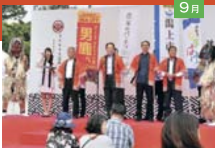
秋田中央地域地場産品活用促進協議会（「農家のパーティ」ネットワーク）のトップセールスを東京上野で実施（9月21日）