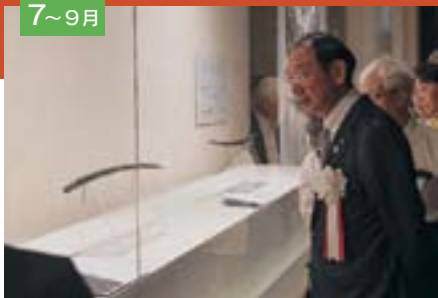
夏に開催した千秋美術館企画展「徳川 美術館名品展 尾張徳川家の至宝」は、 『刀剣女子』も魅了しました