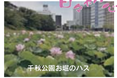
千秋公園お堀のハス