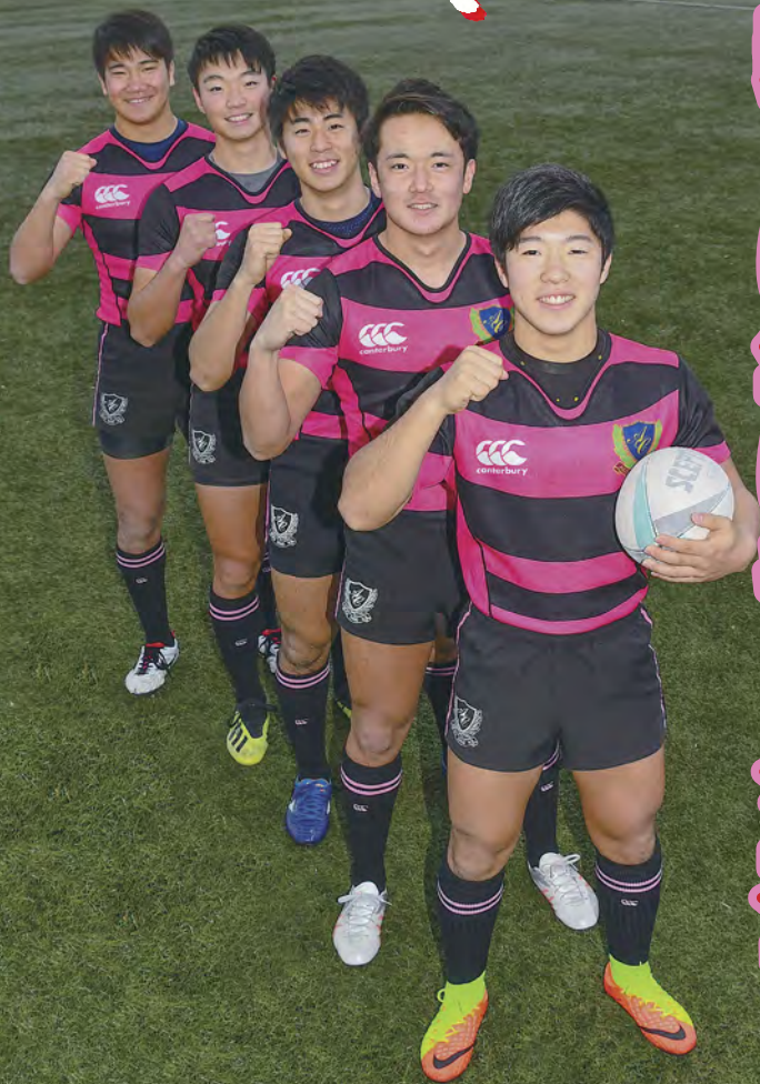
秋田中央高校ラグビー部