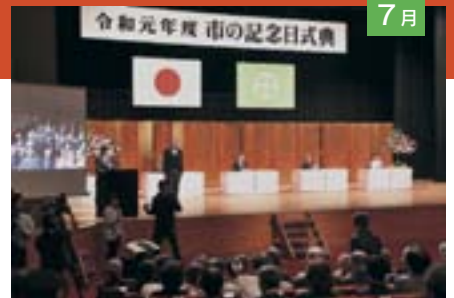
令和元年度は市制130周年の年でもあり、さまざまな記念事業が行われていま す。写真は市の記念日式典〈7月12日〉