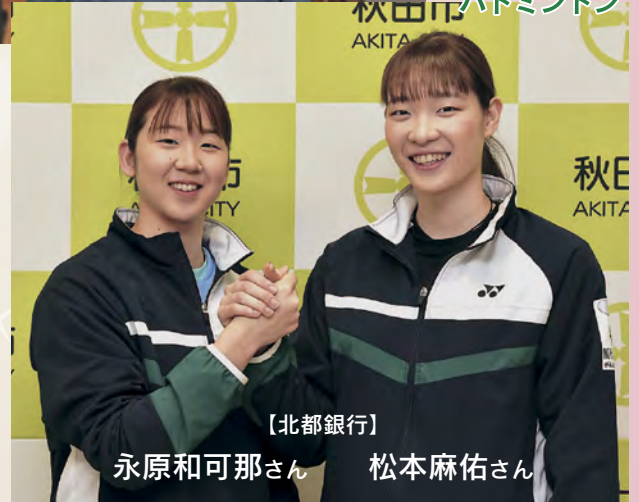
〔北都銀行〕 永原和可那さん 松本麻佑さん