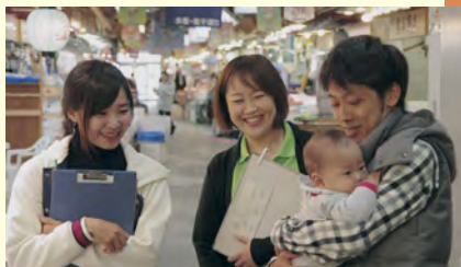
移住体験ツアーで市民市場を案内中