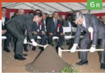
6月 芸術・文化の新たな拠点となる、県・市連携文化施設(令和3年度開館予定)の安全祈願祭を実施しました(6月27日)