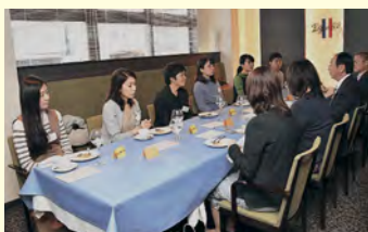
6人が参加しました

若い世代のかたの話を市長が直接聴き、市政運営の参考とするこの取り組み。この日は、移住者のみなさんを対象に、秋田市暮らしに関する感想などを、ランチをいいただきながら伺いました。よりよいまちづくりのための貴重なご意見、ありがとうございました。