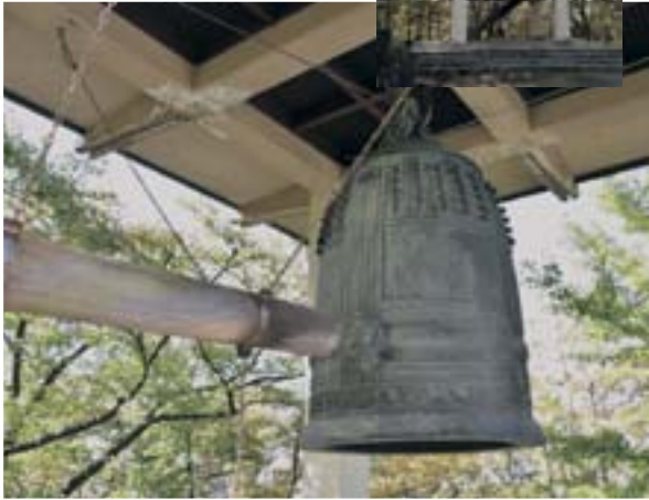
千秋の鐘。公園管理事務所の横にあります

歴史を紐解くと、鐘は何度か廃止の憂き目にあ いながらも、そのたびに危機を乗り越えて復活し てきました。