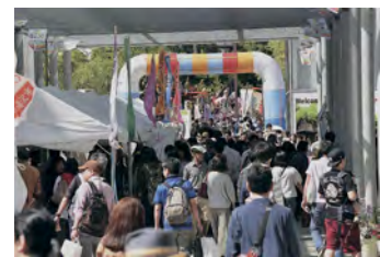
にぎわいが続くまちに

みなさまにとつて、穏やかで、幸せな一年になることを心からお祈り申し上げます。本年もどうぞよろしくお願いいたします。