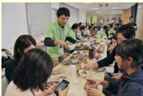
だまご鍋 めしあがれ