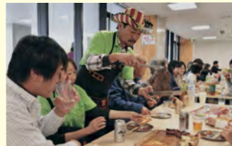
ドーンと県産牛のステーキ!

11月9日、市役所の食堂で開催した「BBQ交流会」に、18組39人のみなさんが参加して、県内産の食材をメインにした料理を食べながら交流を深めました。