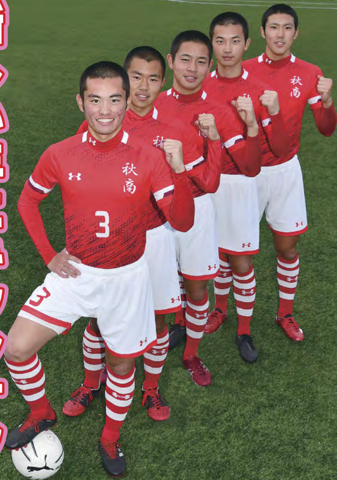
秋田商業高校サッカー部