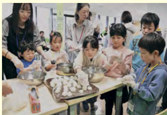
大活躍!「コネコネ隊」

おいしい食材とお酒をいただきながらの秋田流の「BBQ」。おかげで、お互いの距離もぐっと縮まる笑顔の交流会になりました。