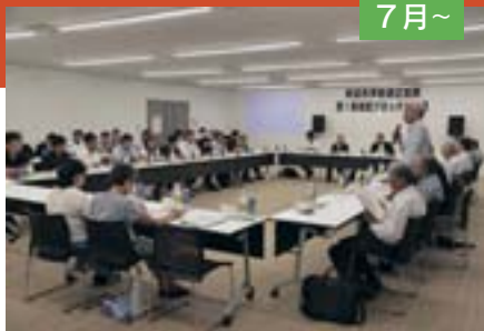
小・中学校の将来のあるべき姿を話し合 う、学校適正配置の地域ブロックごとの 協議会が始まりました