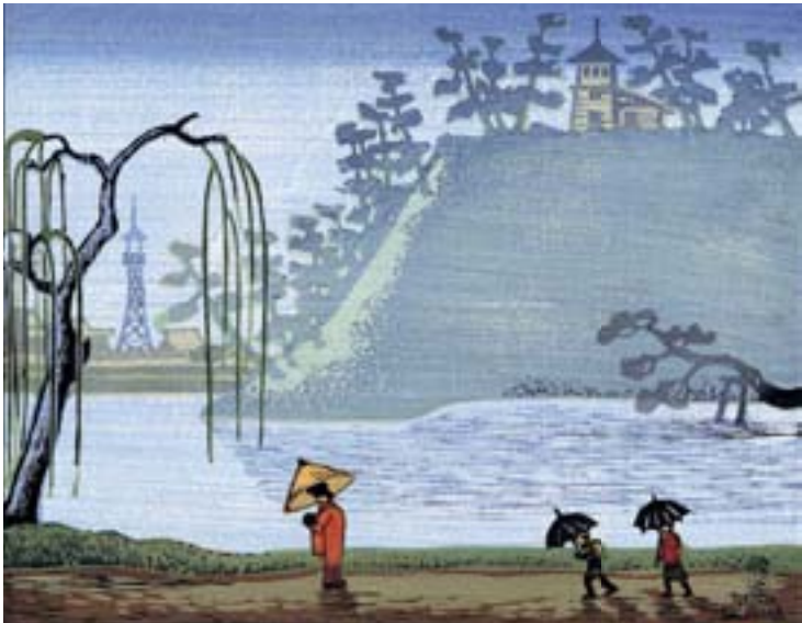
勝平得之〈千秋公園八景〉「雨の内濠」昭和12年 赤れんが郷土館蔵 …鐘楼は右上に

千秋公園の時鐘 ときかね は、寛永16(1639)年、秋田藩二代藩主・佐竹義隆が久保田城二の丸に鐘楼を設置したのが始まりとされ、何度かの改鑄・移転を経て、明治25年に現在の位置(建設中の県・市連携文化施設北側の内堀の上)に設置されました。当時の鐘楼は木造で、素朴な中にも文明開化の香りを感じさせる姿は、秋田市出身の木版画家・勝平得之の〈千秋公園八景〉「雨の内濠」にも描かれています。