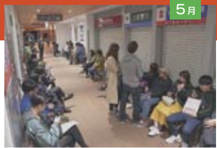
5月 新元号に日付が変わった深夜、婚姻届を提出するカップルで、市役所の臨時窓口がにぎわいました(5月1日)