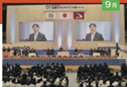
天皇・皇后両陛下ご臨席のもと、「第39回 全国豊かな海づくり大会・あきた大会」式典が開催されました（9月8日）