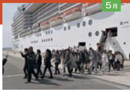
5月 今年度も乗船定員4千人超のMSCプレネディダが秋田港へ。他にも多くのクルーズ船の寄港が10月まで続きました