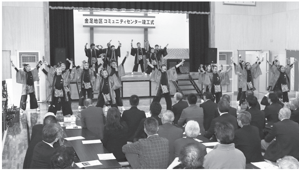
今年の市政も穏やかにスタート。写真は1月19日に 行われた金足地区コミュニティセンターの竣工式で。 金足西小学校のみんながヤートセを披露しました！