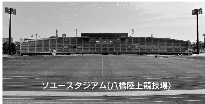
ソユースタジアム(八橋陸上競技場)

冬の間休んでいた屋外体育施設がオープンします。ぜひご利用ください。なお、グラウンド状況や天候などにより、利用開始時期が変更になる場合がありますのでご了承ください。スポーツ振興課 ☎(888)5611