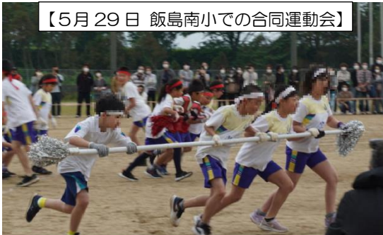
【5月29日 飯島南小での合同運動会】