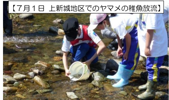
【7月1日 上新城地区でのヤマメの稚魚放流】