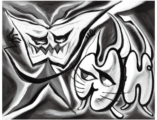
「駄々っ子」1951年 川崎市岡本太郎美術館蔵

*2・3面に掲載した内容は、新型コロナウイルスの影響により、中止または変更になる場合があります。最新情報は、主催者側にお問い合わせいただくか、ホームページなどでご確認ください。なお、ご来場の際は、マスクを着用するなど、感染予防対策にご協力をお願いします。