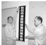
本部の看板を設置

■コールセンター開設までは、道路除排雪対策本部(市役所3階の道路維持課内)へお問い合わせください。☎(888)5751