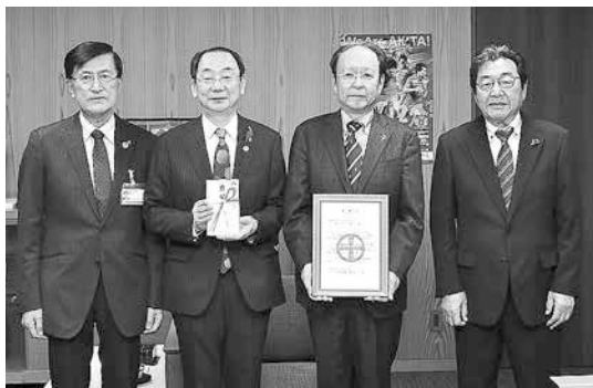
11月20日に行った寄付受納式で