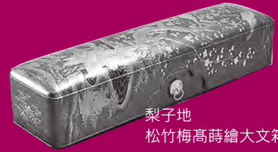
梨子地 松竹梅高蒔繪大文箱