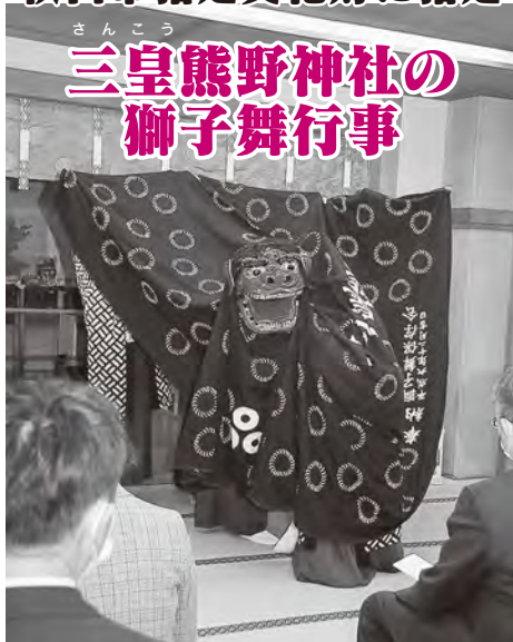
3月28日の文化財指定書交付式で

このたび、新たに「三皇熊野神社の獅子舞行事」を秋田市指定文化財に指定しました。3月28日の指定書交付式では、指定書の交付のほか獅子舞の奉納も行われ、出席した関係者とともにその指定をお祝いしました。文化振興課☎(888)5607