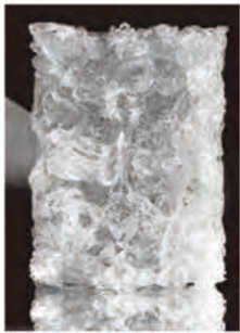
佐々木 光 「Wave_1」