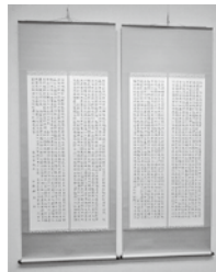
右は展示会出展時の様子。下は作品の一部を拡大