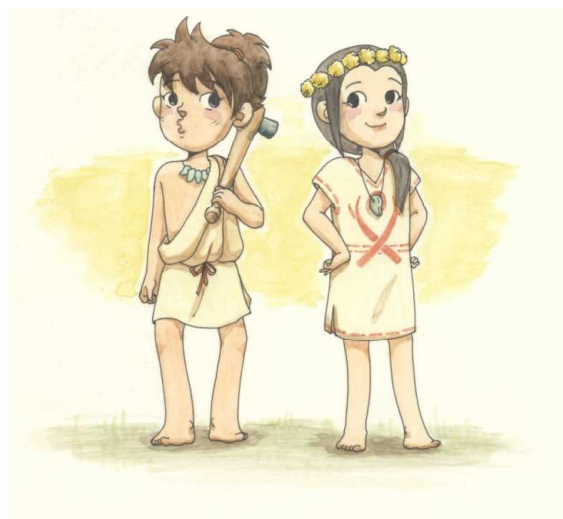
弥太郎くん 弥生ちゃん (地蔵田遺跡弥生っこ村マスコットキャラクター)