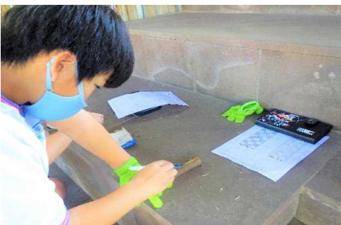
● 彫刻刀の刃の先には、手を置かない。ケガには十分気を付ける。