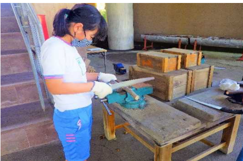
● 万力で枝をしっかり抑え、のこぎりで握り拳程度(7~8cm)の長さに切る。