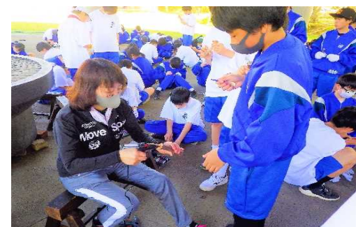
● グルーガンは、乾く前にねじこむように指示し、教師が補助するとよい。