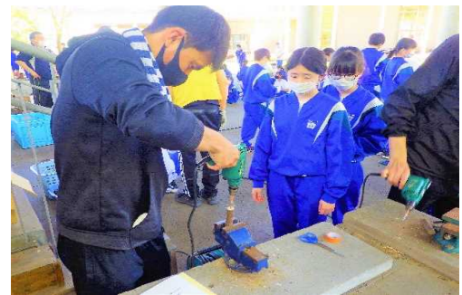
● ドリルの先にテープで3cmの所に印を付け、万力で固定し穴あけする。