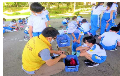
【共通】使い終わった道具も、きれいにそろえて整頓する。