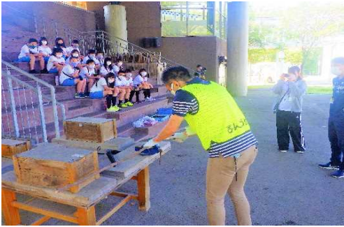
【共通】手順や安全面の配慮を確認する。