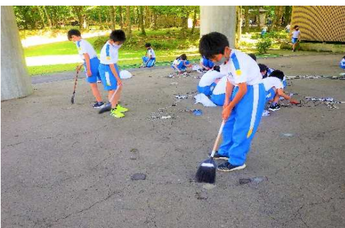
【共通】使い終わった場所は、みんなできれいに掃除する。