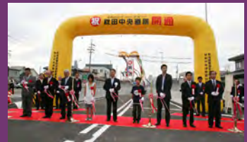
秋田中央道路開通記念式典