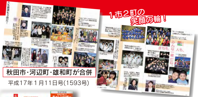
秋田市・河辺町・雄和町が合併 平成17年1月11日号(1593号)