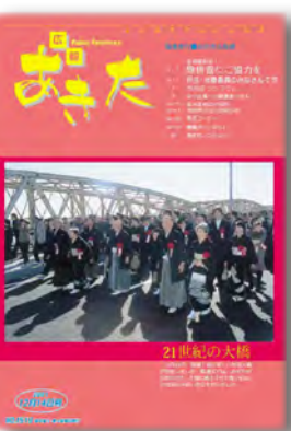
秋田大橋開通 平成13年12月14日号(1519号)