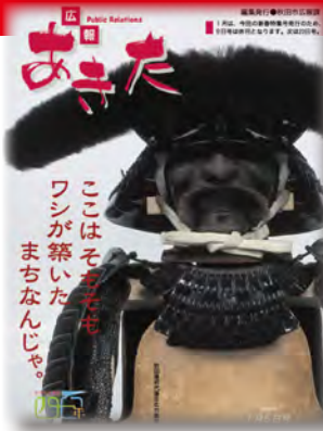
建都400年を迎える 平成16年1月5日号(1509号)