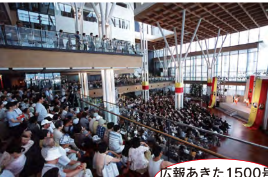
広報あきた1500号 平成13年2月23日号