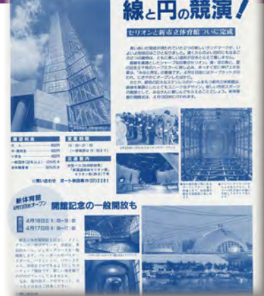
セリオン&市立体育館オープン 平成6年4月10日号(1312号)