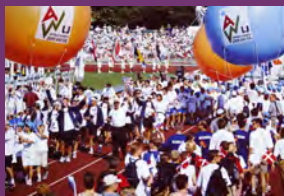
ワールドゲームズ