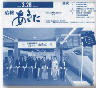
秋田新幹線こまち開通 平成9年3月28日号(1406号)