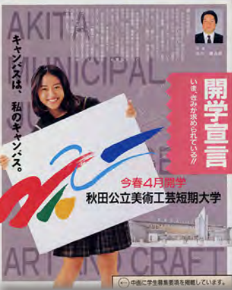
秋田公立美術工芸短大開学 平成7年1月1日号(1338号)