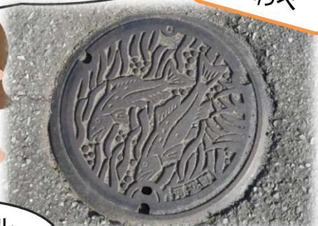
いわみがわのあゆ