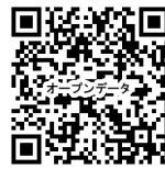
▲オープンデータ公開サイト