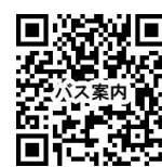
▲秋田市バス案内サービス