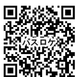
▲秋田市バスロケシステム