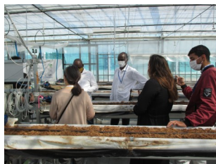
ハウスでの衛生管理を視察

研修員は中央アフリカ共和国、コンゴ共和国、モーリタニア・イスラム共和国、チャド共和国、チュニジア共和国の農業省若手行政官9名です。研修員たちは、土の代わりにヤシの果の繊維を使ったいちごの栽培システムについて熱心に聞いていました。