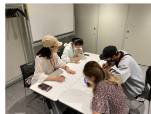
見学後のグループワーク