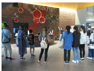
秋田の伝統工芸の説明

ミルハスの館内ツアーと日本語の会話練習を組み合わせたクラスを実施しました。ミルハス職員のやさしい日本語での説明を聞きながら見学をした後、学習者は館内にちりばめられている秋田の伝統工芸をじっくり見たり、写真を撮ったりして楽しみました。見学の後は創作室で自国の有名な音楽というテーマでグループでの会話練習を行い、5名が代表してみんなの前で発表しました。