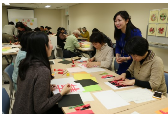
蘭州市研修員による剪紙講座 (2016年)