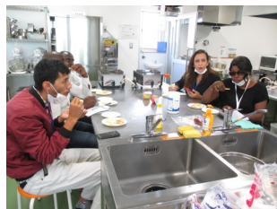
実習で作ったドライフルーツ を試食