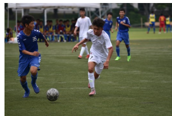
青少年サッカー交流 (2019年)