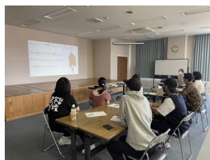
竿燈まつりに関するクイズ

このクラスはとても興味深く楽しいものでした。竿燈についてたくさん学びました。竿燈をあげてみるのが楽しかったです。他では味わえない体験でした。