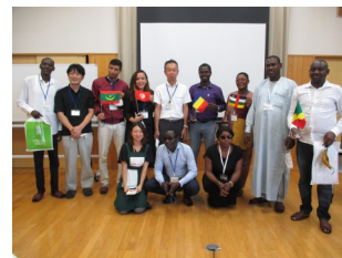
園芸振興センターで 記念撮影