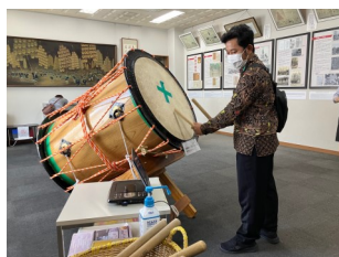
お囃子のリズムに合わせて太鼓練習