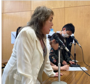
校内放送も行いました