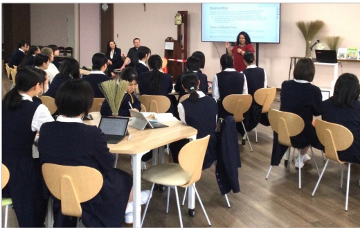
聖霊学園高校での講演会