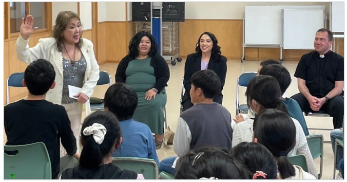
広面小学校での特別授業