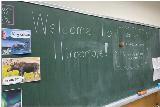
歓迎ムード満載の広面小学校

滞在中は市内の学校を訪問し、授業の見学や特別授業を行いました。また、広面小学校では給食を体験したほか、校内放送でキナイ半島郡の紹介をするなど、児童との親睦を深めました。