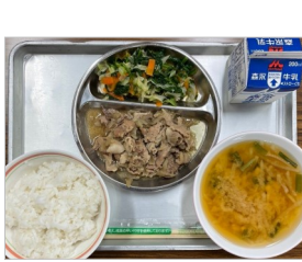
楽しい給食タイム♪