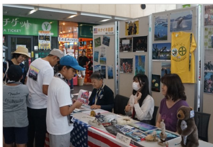
昨年度大賑わいを見せた「秋田市国際フェスタ2023」の様子