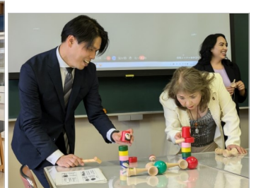
聖霊短大で日本の遊びを体験