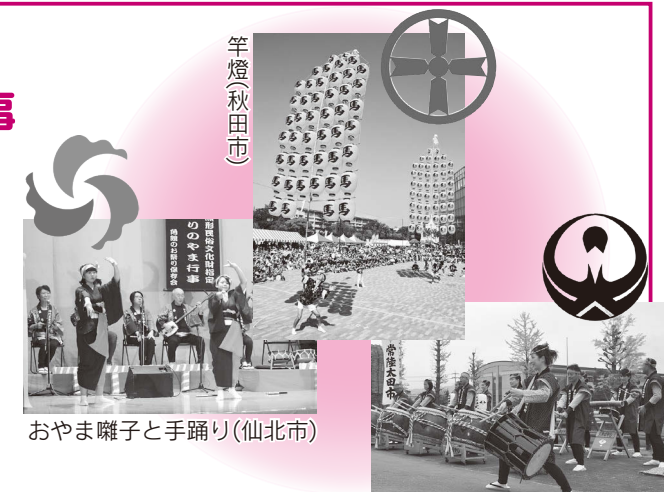
天神ばやし太鼓(常陸太田市)