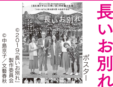
長いお別れ ポスター