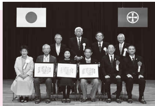
市長賞、教育長賞、委員長賞の受賞者のみなさん(10月28日、授賞式で)