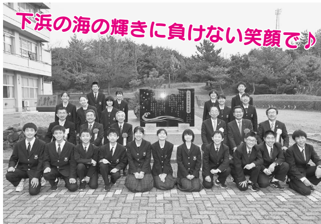
下浜の海の輝きに負けない笑顔で♪