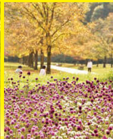
太平山リゾート公園