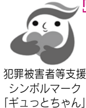
支援者マーク 等ボランティア 被害者サポート シンギョウ

この機会に、犯罪防止や被害者支援のために何ができるかを考えましょう。市民相談センター(市役所1階)では、犯罪被害者などの支援