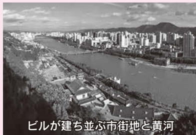
ビルが建ち並ぶ市街地と黄河