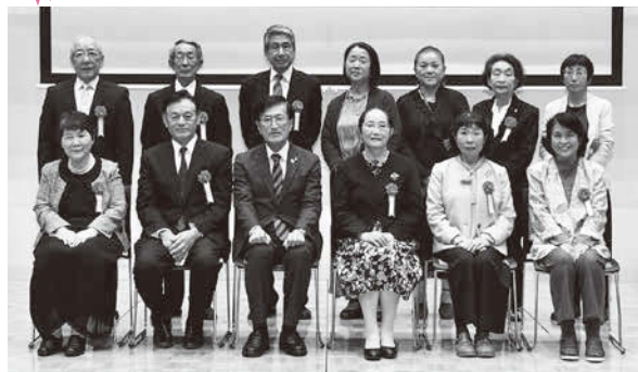
感謝状贈呈式に出席したみなさん

秋田市の健康づくりを進めていくうえで、地域保健推進員のみなさんは心強いパートナーです。現在、約1千300人が、健康教室の開催やがん検診の周知活動などを通して、地域での健康づくりを進めています。