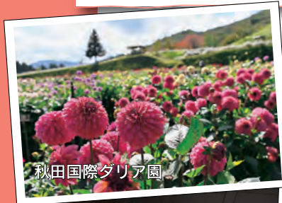
秋田国際ダリア園