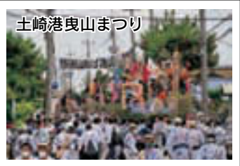
土崎港曳山まつり

季節を直に感じる生活 ぬくもりあふれる故郷の味 ちよ う どい い から住みやすい 外旭川中