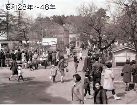
千歳公園内にあった「市立児童動物園」