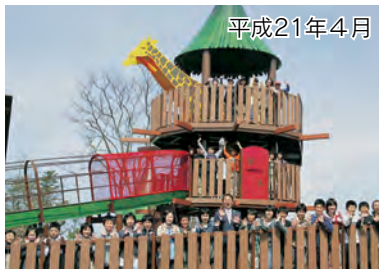
動物を間近で見ながら楽しめる 大型遊具「アソヴェの森」完成