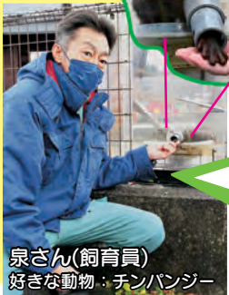
泉さん(飼育員) 好きな動物：チンパンジー

お腹を空かせていると、飼育員の長靴をかじってくるので、キャットフードなどのおやつをあげているよ