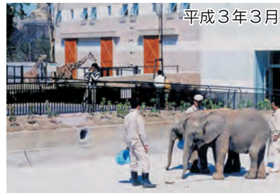
市政100周年記念事業として ゾウ、キリンが仲間入り