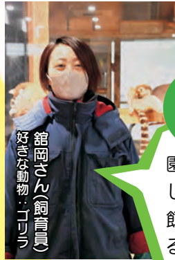
館岡さん(飼育員) 好きな動物：ゴリラ