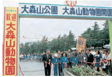
開園オープニング式典で