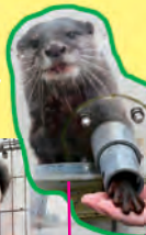
キトラ 好きな食べ物：アジ

餌やり体験では、筒を通して直接カワウソの手に触れることができるよ。ふにやっとした柔らかい手を伸ばして、餌を取ろうとするかわいらしい仕草は必見！ 展示室では、コーヒー豆を入れる“麻袋”の中で寝るのがお気に入りだよ。