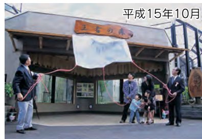
猛獣舎「王者の森」完成。開園30 周年の記念式典とあわせてお祝い