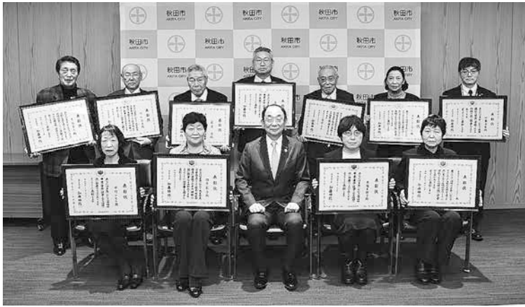
1月19日の表彰状伝達式に出席されたみなさん