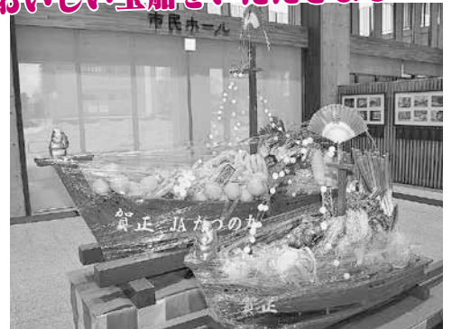
市民ホールに展示されました