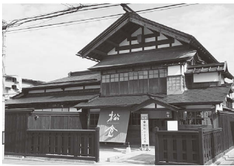
県指定有形文化財 旧松倉家住宅