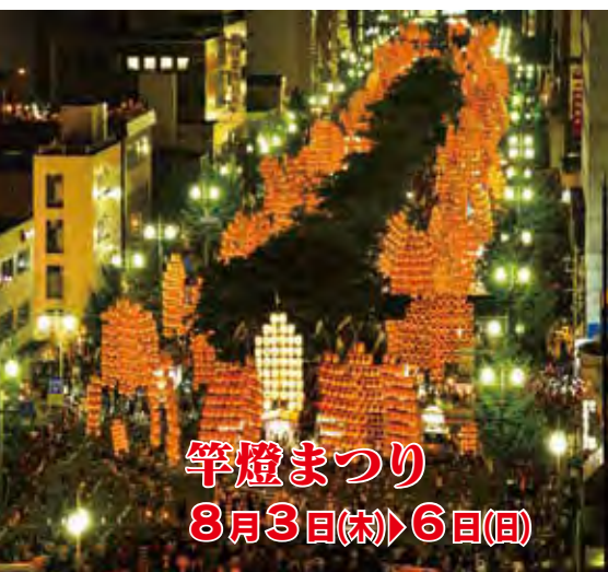
竿燈まつり 8月3日(木)▶6日(日)