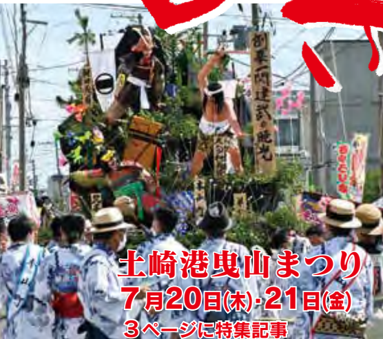
土崎港夷山まつり 7月20日(木)・21日(金) 3ページに特集記事