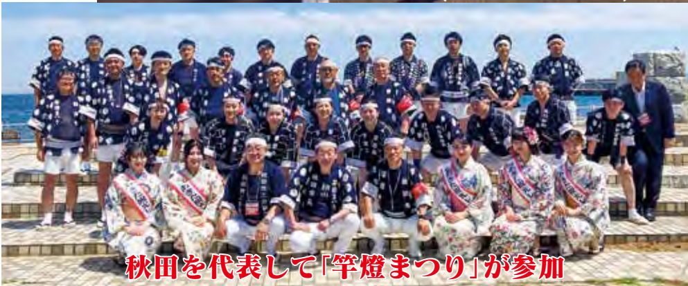
秋田を代表して「竿燈まつり」が参加