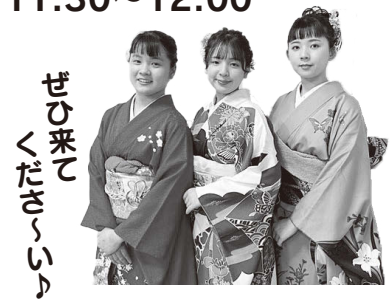
ぜひ来て くださーい♪