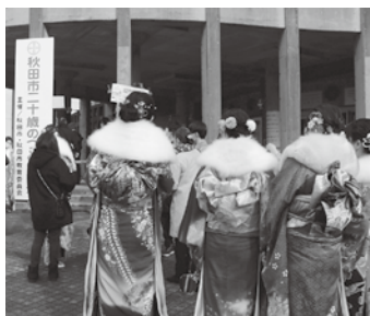
令和4年度の二十歳のつどい