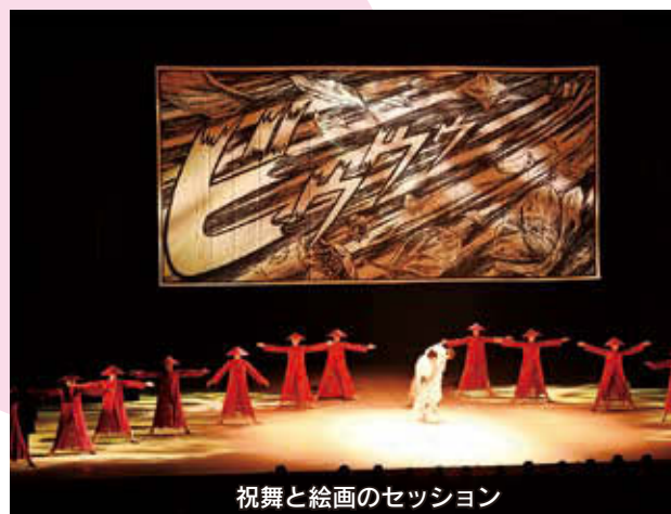
祝舞と絵画のセッション