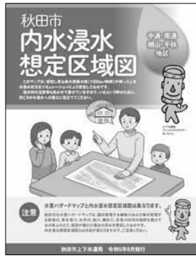
リーフレット表紙