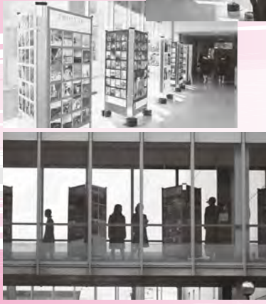
秋田北高校での開催の様子

会場(開催順)▼秋田北、秋田、新屋、金足農業、秋田商業、秋田南、秋田中央、御所野学院、秋田工業、秋田明徳館