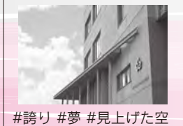
#誇り #夢 #見上げた空