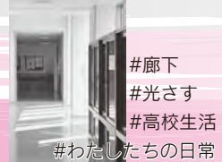
#廊下 #光さす #高校生活 #わたしたちの日常