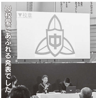
母校愛にあふれる発表でした