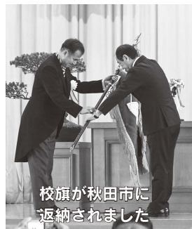
校旗が秋田市に返納されました