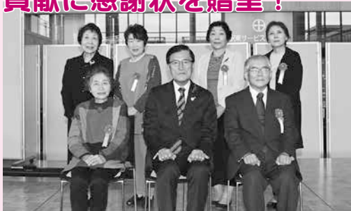
感謝状贈呈式に出席したみなさん

秋田市の健康づくりを進めていくうえで地域保健推進員のみなさんは心強いパートナーです。現在、約1,300人が健康教室の開催やがん検診の周知活動などを通して、地域での健康づくりを進めています。