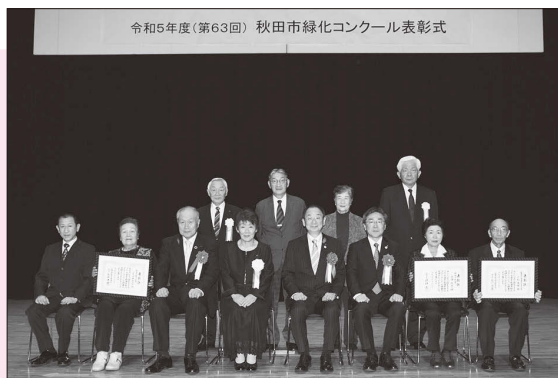
令和5年度(第63回)秋田市緑化コンクール表彰式