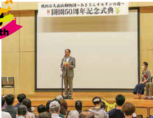
9月 西部市民サービスセンターで、大森山動物園開園50周年記念式典が開催されました