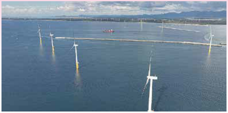
秋田港の洋上風力発電所

秋田港では国内有数の恵まれた風況を生かした洋上風力発電事業が進展し、エネルギーの地産地活はもとより、脱炭素の実現に向けたまちづくりの機運が高まっています。本市にとって「風」は、江戸時代に北海道から大阪まで日本海を往来した北前船の隆盛がもたらす都市の文化的・経済的な発展の源となったものであり、他方では能代市から本市に至る約120kmの防砂林を築いた栗田定之丞の功績が語り継がれるほど、市民生活を悩ませてきたものです。こうしたまちの歴史や記憶をたどりながら、ここにしかないモノやコトに新たな価値を見出し、まちの活力を高めていきたいと思えます。