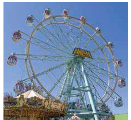
4月 大森山ゆうえんちアニバの観覧車が新しくなりました。愛称はフランス語で花を意味する「フルール」♪