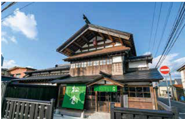
■3月 修復整備工事を終えた県指定有形文化財「旧松倉家住宅」が、町家の趣を残し新たなにぎわいの場としてオープン