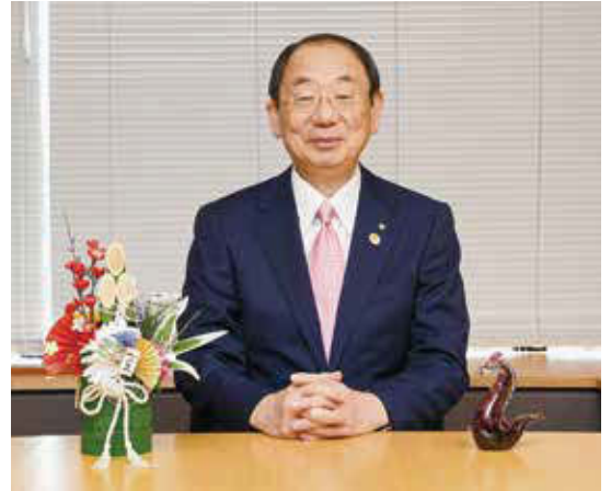
秋田市長 ● 穂積 志(もとむ)