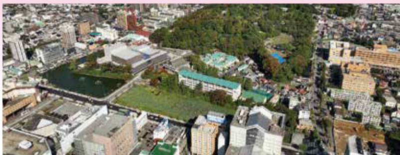
空から見た芸術文化ゾーン。中核市サミットのメイン会場になります