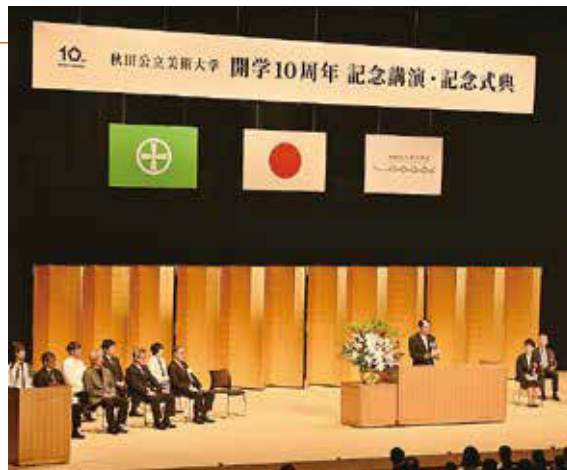
7月 あきた芸術劇場ミルハス大ホールで、秋田公立美術大学開学10周年記念講演・記念式典が開催されました