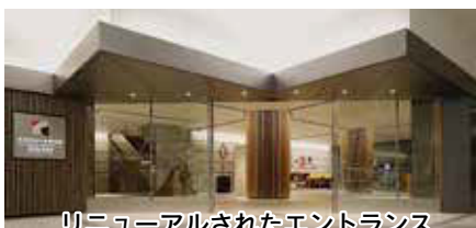
リニューアルされたエントランス (千秋美術館)

令和7年10月には新しい佐竹史料館が開館予定です。これまで以上に芸術文化ゾーンを核とした中心市街地における文化施設間の連携を図り、日常的に市民が集い、活動し、心豊かな暮らしを実現できる場の創出に取り組みます。