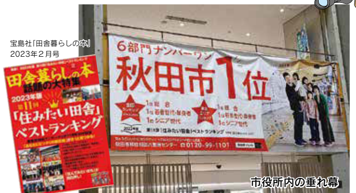
■1月 「田舎暮らしの本」(宝島社)「住みたい田舎」ベストランキング6部門で秋田市が1位を獲得しました