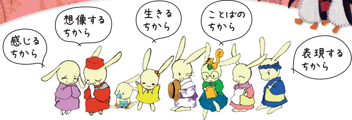
うさこファミリー(秋田市立図書館イメージキャラクター)