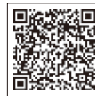
全国避難所ガイド