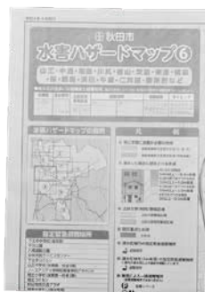
水害ハザードマップ