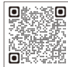
水害ハザードマップ