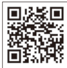
防災ネットあきた

下記コードを読み取り、空メールを送信し、表示内容に従って登録するか、市ホームページをご確認ください。 ◆ 広報ID番号 1009827