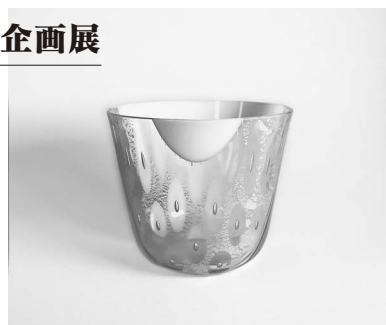
(写真は展示作品のイメージです)