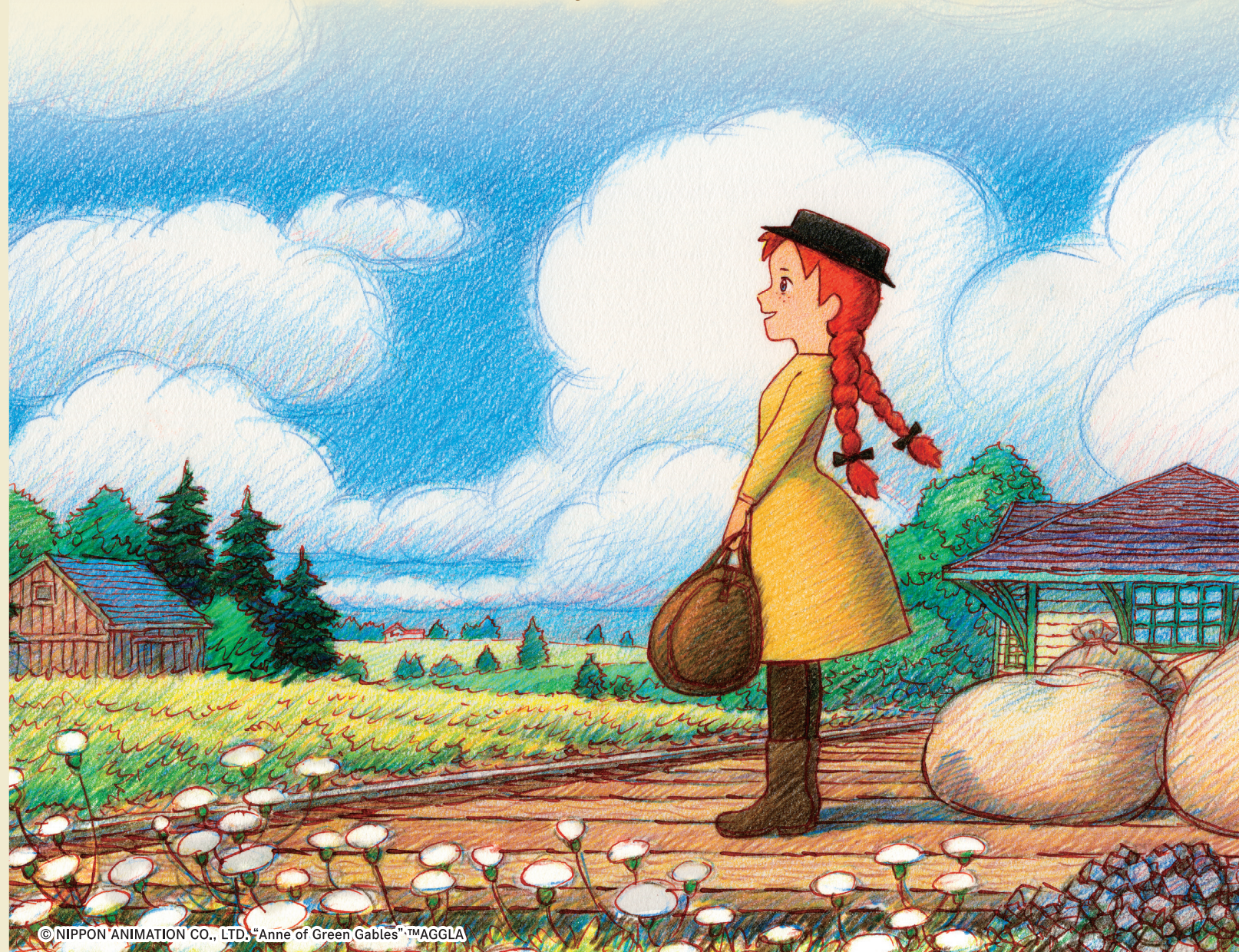
© NIPPON ANIMATION CO., LTD. "Anne of Green Gables" TMAGGLA

あたたかな家庭を心から願ったアンは、マッシュウとマリラに出会い、二人の愛情に包まれながら、自分らしく豊かで幸せな人生を歩みます。