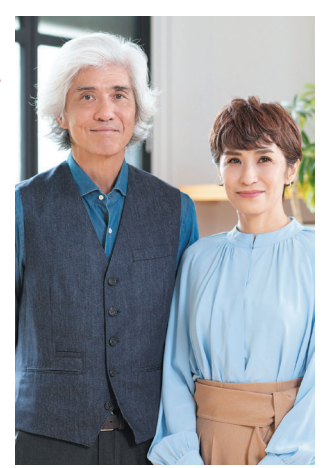
さとうこういち / 1960年、東京都生まれ。19歳で俳優デビュー。日本アカデミー賞最優秀主演男優賞をはじめ、数々の賞を受賞。さとうあやこ / 舞台女優として活動後、1993年に結婚。2014年より児童養護施設の子どもを支えるボランティアを始める。

分間、車中での時間を彼女がとても大事に感じてくれるというのが伝わってきて、僕もその空気感が好きで。教えてもらったことがいっぱいあったあと振り返って」(浩市さん) 「週末だけ、お休みのときだけでも、家庭生活を送ることは子どもの未来に変化を起こすと思います。里親制度をぜひ知ってほしいです」(亜矢子さん) 「責任はあるから、背伸びは必要なんです。でも、ずっと背伸びしていたら相手も疲れてしまいますよね。あるとき背伸びをやめたかかとを落としたり、背伸びしていたときに見える景色が同じだったんです。僕が子どもと関わったからなんだと思っています」(浩市さん)