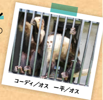
コーディ/オス 一平/オス

2023年7月7日に市原ぞうの国(千葉県)に引っ越ししました。ノドジロオマキザルはちょいワルな顔つきですが、とても頭が良く、見ていて飽きない動物です。市原ぞうの国でも人気者になってほしいものです。