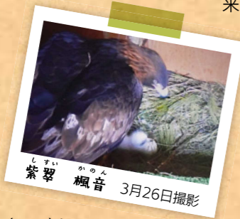
しずい 紫雲 楓音 3月26日撮影