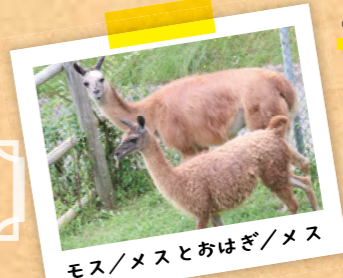
モス/メスとおはぎ/メス

2023年7月6日に市原ぞうの国(千葉県)から来園しました。おはぎはまだ幼く、モスは成長したラマです。おはぎはトレーニングを重ね、秋の動物ふれあいフェスティバルで動物パレードに参加しました。