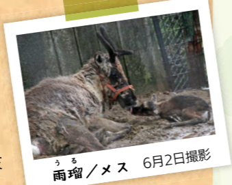
うる 雨瑠/メス 6月2日撮影

2023年6月2日に5年ぶりに生まれました。2018年に大森山で生まれた春来がお父さんで、2020年に那須どうぶつ王国(栃木県)から来園したルミがお母さんです。ルミは初めてのお産で心配でしたが、生まれた直後に子どもは、しっかりおっぱいを飲み安心しました。雨の日に生まれたルミの子どもということで、「雨瑠」という名前になりました。